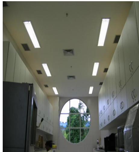
COPA E COZINHA NAN