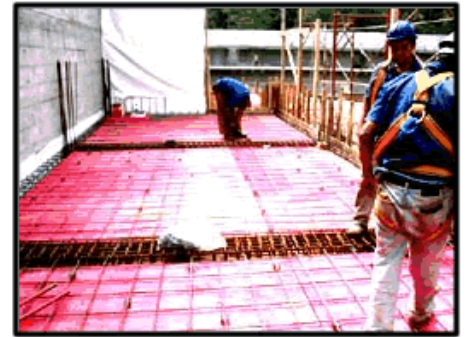
Concretagem Laje - 1º pavimento