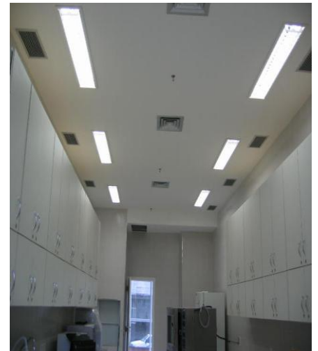
COPA PRA 500 PES.