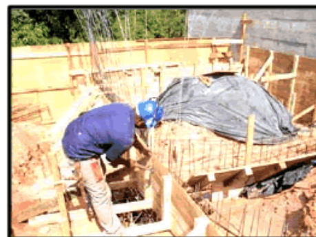
Concretagem Baldranel Nível 0