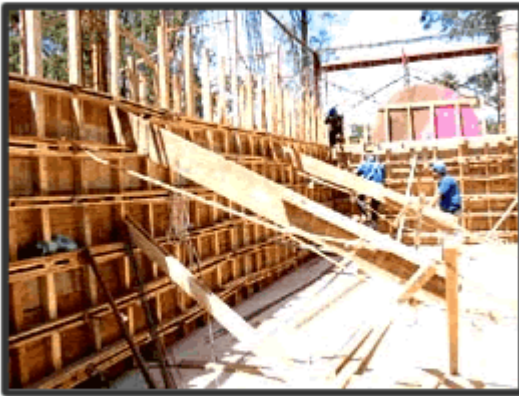
Concretagem Parede Nível 2.0 mt- 2º pavimento