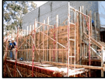
Concretagem Parede Nível 3.0 mt/ terra